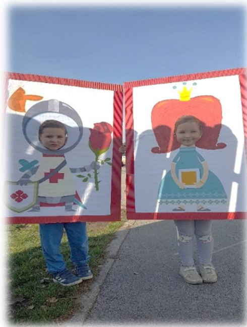
»Otroci so se fotografirali z modeli, narejenimi iz kartona«

Na gradu so lahko starši opazovali okolico Ptuja s svojimi otroki, lahko so se fotografirali s pomočjo 2 kartonov, kjer je bila na enem narisana grajska gospa , na drugem pa vojak . Otroci so čez čas odkrili tudi drugo škatlo, v kateri so se prav tako skrivali leseni delci gradu.