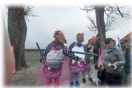
»Rimska vojska nas je popeljala na grad«