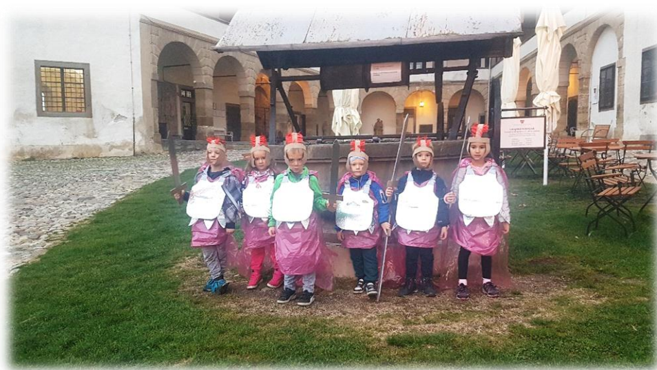
»Rimska vojska na grajskem dvorišču«