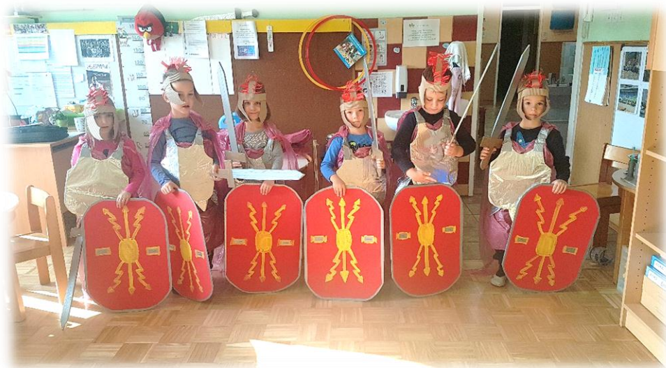
»Otroci so se oblekli v rimske vojake«

Otroci in starši so se dne 8.11.2018 ob 16.00 zbrali na dvorišču našega vrtca.